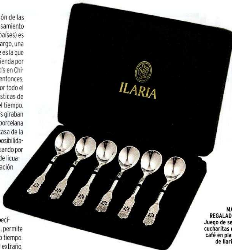
MÁS REGALADO. Juego de seis cucharitas de café en plata de Ilaria.