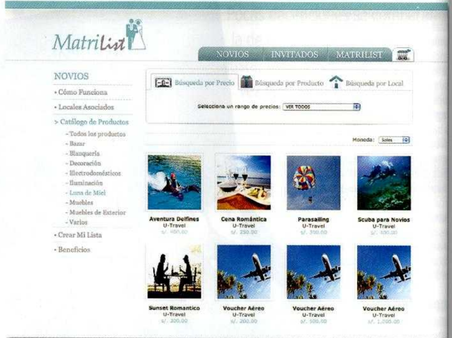
NOVEDOSO. La lista de novios virtual de Matrilist permite regalar experiencias inolvidables para la luna de miel de la pareja tales como cenas románticas, scuba diving o un chapuzón con delfines.