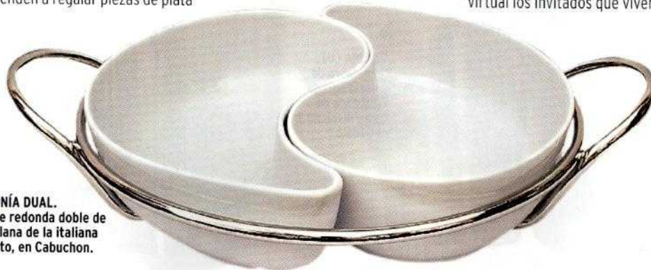
ARMONÍA DUAL. Fuente redonda doble de porcelana de la italiana Zanetto, en Cabuchon.

¿Los beneficios? Muchísimos. Para empezar, los novios tienen la ventaja de crear una lista en la que abarquen más de un rubro (obteniendo productos de platería, hogar, electrodomésticos, etc.) en un solo lugar y acceden a regalos de diferentes tiendas con una sola lista. Matrilist trabaja con un grupo de reconocidos locales asociados como El Tupu, Ferrini, Kolke, Joyería Murguía, PPPP Design, Lalí Spihlmann y Yaku Spa. Además, al tener una lista de novios virtual los invitados que viven en el